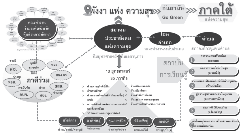
ภาพที่ 8 ผังแสดงประเด็นยุทธศาสตร์ โครงข่ายการทำงานของประชาคมมาในระดับจังหวัด หลักสูตรเรียนรู้ และภาคีในระดับชาติ

ภายในขอบวงเอง ระดับที่เชื่อมโยงออกไปภายนอกในจังหวัด (ซึ่งมีตัวแทนของประชาคมที่ทำงานใกล้ชิดกับกลไกรัฐในระดับจังหวัดเป็นรายประเด็น) ระดับที่เชื่อมโยงออกไปสู่พื้นที่ภูมินิเวศชายฝั่งอันดามัน (อันดามัน GO GREEN) และระดับเชื่อมโยงกับเครือข่ายต่าง ๆ ในภาคใต้ซึ่งมีเป้าหมายการเป็น “ภาคใต้แห่งความสุข” ระดับประเทศซึ่งเป็นการเชื่อมโยงกับองค์กรรัฐที่ส่งเสริมและสนับสนุนความเข้มแข็งของภาคประชาชน (โปรดดูภาพ 8 และ 9 ประกอบ)