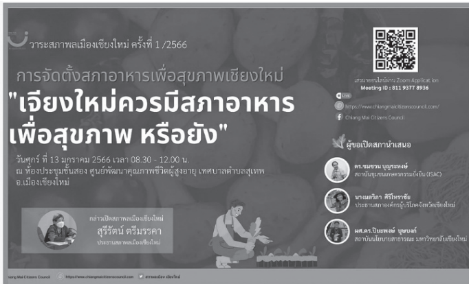
ภาพที่ 1 การสื่อสารการจัดประชุมสภาพลเมือง

มาจากการสุ่มคัดเลือกเป็นเฉพาะกิจจากกลุ่มผู้มีความรู้และได้รับการยอมรับนับถือเพื่อมาให้ความเห็นต่อประเด็นที่ได้รับการพิจารณาในที่ประชุม (5) ผู้แทนหน่วยงานรัฐ ที่เกี่ยวข้องกับประเด็นตามวาระพิจารณา ซึ่งอาจเป็นองค์กรปกครองส่วนท้องถิ่น หรือหน่วยงานราชการอื่น ๆ ในจังหวัดเชียงใหม่ (6) สื่อมวลชน ซึ่งได้รับเชิญหรือติดตามเข้ามาเพื่อเผยแพร่สื่อสารเนื้อหาสาระและกิจกรรมการประชุมสู่สาธารณะ โดยจะมีการถ่ายทอดสดและนำคลิปการประชุมนำเสนอในเว็บไซต์ของสภาพลเมืองด้วย และ (7) ฝ่ายเลขานุการการประชุม ซึ่งได้แก่ คณะทำงานของกองเลขานุการซึ่งเป็นตัวแทนองค์กรหรือเครือข่ายที่ร่วมเป็นสมาชิกสภาพลเมืองนั่นเอง