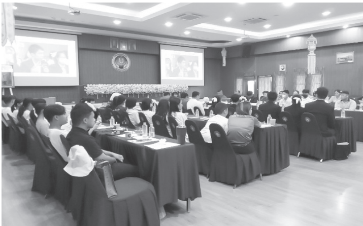
ภาพที่ 2 การประชุมสภาพลเมือง

เปิดประชุม เช่น ครั้งที่ 1/2556 เป็นวาระ “การขนส่งสาธารณะในจังหวัด เชียงใหม่” ครั้งที่ 2/2556 เป็นวาระ “ช่วงหลวงเวียงแก้ว” ครั้งที่ 1/2558 เป็นวาระ “ช่วงหลวงเวียงแก้ว (ตามความคืบหน้า)” ครั้งที่ 2/2558 เป็นวาระ “ช่วยชีวิตต้นไม้ใหญ่” ครั้งที่ 2/2563 เป็นวาระ “ผลกระทบโควิด 19 ต่อ กลุ่มคนเปราะบางเชียงใหม่” วาระที่ 1/2566 เป็นวาระ “การจัดตั้งสภา อาหารเพื่อสุขภาพเชียงใหม่” วาระที่ 2/2566 เป็นวาระ “การจัดการไฟฟ้า ขนาดใหญ่ในภาคเหนือ ทางออกที่เหมาะสมสอดคล้องกับสภาพชีวิต” ครั้งที่ 4/ 2566 เป็นวาระ “โอกาส = อนาคต พื้นที่สร้างสรรค์ใหม่ในสายตา เยาวชนกับความเป็นไปได้ในการผลักดันเมืองในฝัน” ครั้งที่ 5/2566 ประเด็น น้ำ “แม่ควา จากอดีต ปัจจุบัน สู่ออนาคต บทบาทของท้องถิ่นกับการบริหารจัดการแม่น้ำควาร่วมกัน” (สภาพลเมืองเชียงใหม่, 2556) เป็นต้น