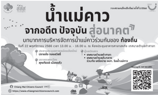
ภาพที่ 3 การสื่อสารการประชุมสภาพลเมือง

จากที่กล่าวมา สภาพลเมืองเชียงใหม่เป็นสิ่งที่แยกไม่ออกกับกระบวนการก่อเกิดของแนวคิดและเจตจำนงในการจัดการตนเองของภาคประชาชนที่พยายามผลักดันใช้กลไกและกระบวนการย่อย ๆ หลายประการเพื่อขับเคลื่อนแนวคิดนี้ไปสู่การกระจายอำนาจและการสร้างฐานความเข้มแข็งของภาคประชาชนเพื่อเป็นฐานรองรับการกระจายอำนาจซึ่งจะเป็นการเติมเต็มช่องว่างที่เกิดขึ้นบนสะพานความเชื่อมโยงระหว่างรัฐกับประชาชนภายใต้ระบบการเมืองแบบตัวแทนและระบบการปกครองที่ให้อำนาจหรือสิทธิแก่ประชาชนในการมีส่วนร่วมบริหารจัดการประเทศและพื้นที่ตนเองอย่างจำกัด กระบวนการเช่นนี้ไม่ควรถูกพิจารณาหรือจับจ้องมองเฉพาะสิ่งที่เกิดขึ้นในพื้นที่จังหวัดเชียงใหม่เท่านั้น หากแต่ต้องมองถึงการส่งต่อและกระจายความเคลื่อนไหวทางสังคมของภาคประชาชนนี้ไปสู่ทุกจังหวัดและทุกพื้นที่ในประเทศ รวมถึงทุกพื้นที่ในปริมนทลทางวิชาการ ทางการศึกษาทางวิชาการ ทางกระบวนการนิติบัญญัติ หรือแม้แต่ในระบบราชการที่ต้องมีปฏิริยาต่อขบวนการเคลื่อนไหวเหล่านี้ การประเมินว่า กระบวนการของแนวคิด