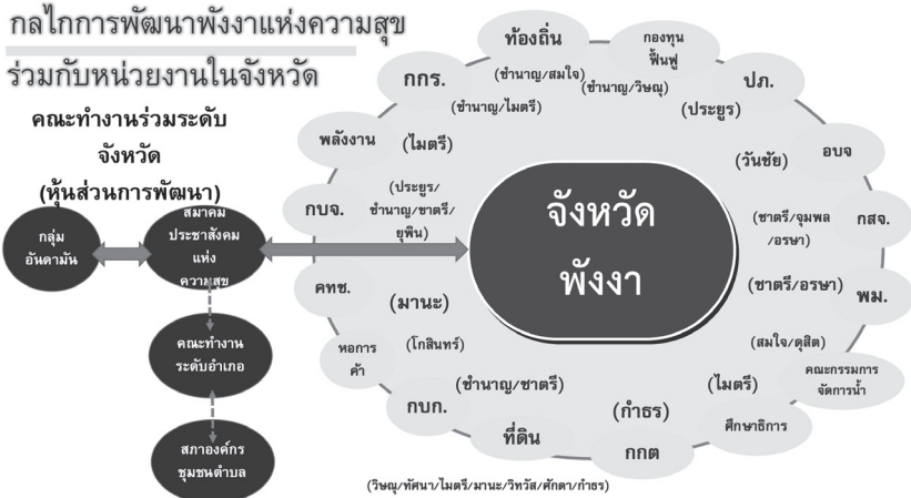
ภาพที่ 9 ผังแสดงระบบโครงข่ายและกลไกการทำงานภายในที่เชื่อมโยงกับหน่วยงานภาครัฐ และองค์กรหรือกลุ่มภาคประชาสังคมต่าง ๆ ภายในจังหวัดพังงา

นอกจากโครงสร้างและเครือข่ายการทำงานที่ปรากฏตามภาพที่ 8 และ 9 ข้างต้นแล้ว ความก้าวหน้าของการทำงานยังมีเหตุปัจจัยอื่น ๆ ที่มีส่วนสำคัญมากคือ (1) ความเชื่อมโยงกับสถาบันวิชาการที่เข้ามาสนับสนุนทางวิชาการ เช่น สถาบันอาศรมศิลป์ที่เข้ามาร่วมทำวิจัยเพื่อกำหนดเป้าหมายร่วมและผังการพัฒนาของชาวจังหวัดพังงา มหาวิทยาลัยธรรมศาสตร์ที่เข้ามาร่วมวางรากฐานหลักสูตรการเรียนรู้ เป็นต้น (2) การทำงานแบบเข้าถึงกลไกทางนโยบายภาครัฐในฝ่ายการเมืองและฝ่ายประจำ และ (3) ความสามารถในการเข้าถึงแหล่งทุนดำเนินการจากงบประมาณของหน่วยงานภาครัฐต่าง ๆ โดยที่ขบวนประชาคมพังงาแห่งความสุขยังคงสามารถกำหนดเป้าหมาย